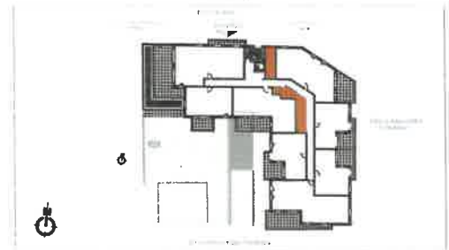
PLAN DE VENTE